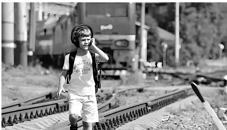
Самая распространенная причина травматизма на железной дороге — хождение по путям

Во избежание поражения электрическим током нельзя влезать на крыши вагонов. В контактной сети высокое напряжение.